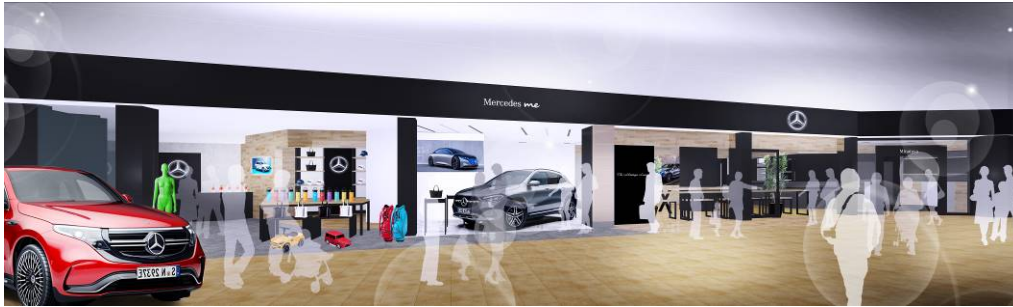
レコナ エアフレッシュ (株式会社キャンディル)による抗ウイルス抗菌コーティングを施工