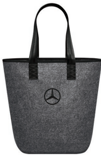
ショッピングバッグ シートベルトハンドル 3,250 円