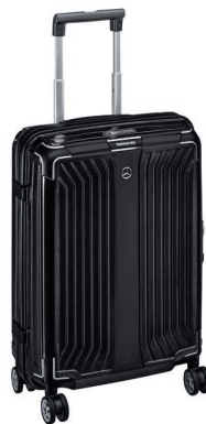
サムソナイトスーツケース ブラック 75L 84,700 円