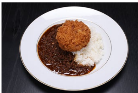
メンチカツカレー 900 円