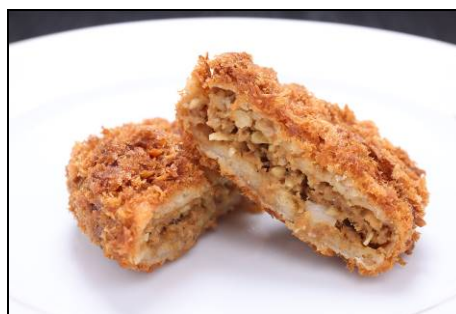
メンチカツ 250 円