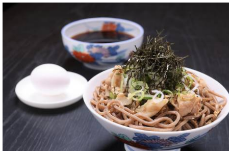
冷たい肉そば 950 円 small 750 円

The Minatoya Loungeは虎ノ門にあった港屋、大手町にある港屋 2、六本木にあるブランド発信拠点メルセデス ミー東京のMinatoya 3に次ぐ店舗にあたります。メニューは港屋で多くのお客さまに愛された「冷たい肉そば」やMinatoya 3で提供している「Minatoya3 Vision “ Mercedes AMG GT Atatakai-Nikusoba ”(温かい肉そば)」をはじめ、メルセデス ミー羽田エアポート限定の港屋オリジナル「メンチカツ」や「メンチカツカレー」等も展開し、小さめのサイズもご用意いたしております。また“Lounge”の名の通り、これからご旅行に出発される方々、お帰りになられました方々が、ごゆっくりとおくつろぎいただけます空間の演出も施しました。The Minatoya Loungeでは、みなさまを心よりお迎えいたします。メルセデスオーナーさまへのサービスも充実させ、ご愛車のメルセデス・キー(鍵)をお持ちくだされば、好きなウエルカムドリンク1杯(ソフトドリンク、コーヒー、アルコール)を無料にてご用意させていただきます。