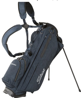
Mercedes-Benz x Titleist スタンドバッグ ヘザーネイビー 44,000 円