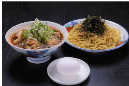
温かい肉そば 950 円 small 750 円