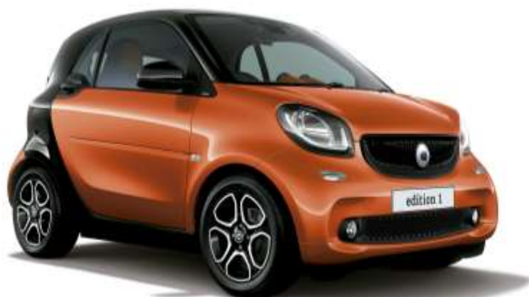
smart fortwo edition1 lava orange