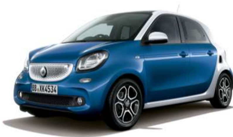
smart forfour prime