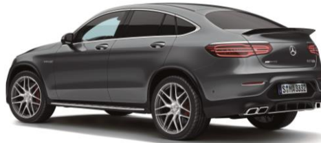
(左)メルセデス AMG GLC 63 4MATIC+ クーペ (右)メルセデス AMG GLC 63 S 4MATIC+ クーペ