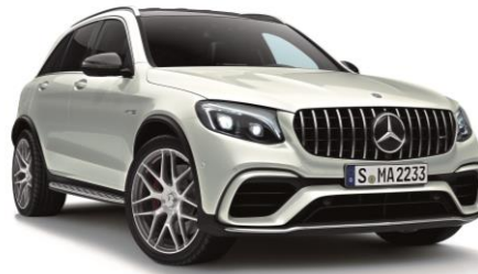
(左)メルセデス AMG GLC 63 4MATIC+ (右)メルセデス AMG GLC 63 S 4MATIC+