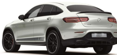
(左)メルセデス AMG GLC 63 S 4MATIC+ Edition 1 (右)メルセデス AMG GLC 63 S 4MATIC+ クーペ Edition 1