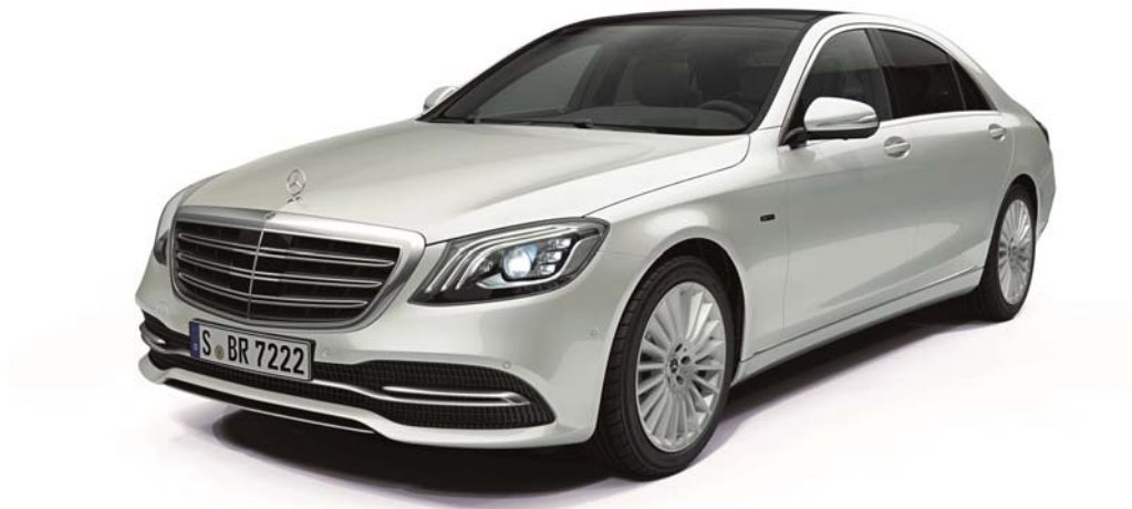
メルセデス・ベンツ S 560 e ロング

*6: 新車登録日から 59 ヶ月後の応当日の前日、または総走行距離 75,000km 到達時のいずれか早い時点で終了となります。