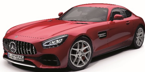
メルセデス AMG GT

さらに、メルセデス・ケア終了後、有償の保証延長プログラムとして、一般保証および24時間ツーリングサポートを2年間延長する「保証プラス」をご用意しています。