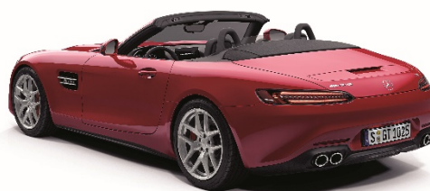
メルセデス AMG GT ロードスター