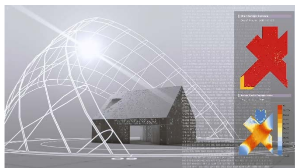
日照パターンのシミュレーション